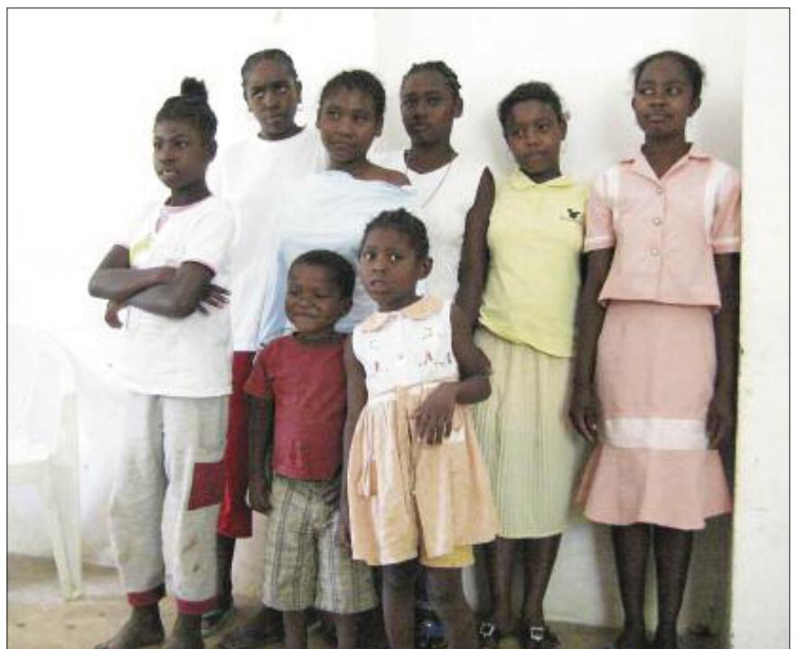
HÅPOM OPPLÆRING: Her er åtte av de døve barna som verdalingene kan hjelpe med skolegang, til et verdig liv og ut av isolasjonen.